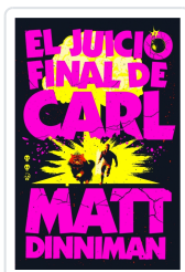
JUICIO FINAL DE CARL, EL (CARL EL MAZMORRERO 2) Dinniman, Matt