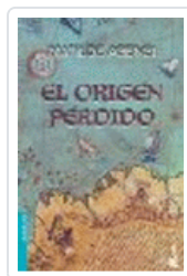
ORIGEN PERDIDO (NF) MATILDE ASENSI