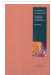
APUESTA POR LA GLOBALIZACION GOWAN