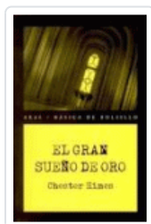
GRAN SUEÑO DE ORO