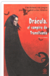
DRACULA, EL VAMPIRO DE TRANSILVANIA JUAREZ, JORGE M.