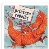
PRINCESA REBELDE, LA KEMP, ANNA