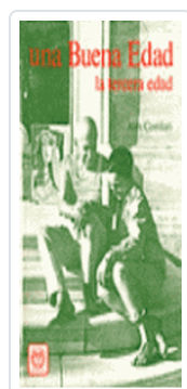
BUENA EDAD, UNA COMFORT