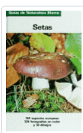
SETAS GNB GRUNERT