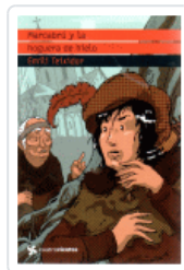
MARCABRU Y LA HOGUERA DE HIELO (CUATROVIENTOS) TEIXIDOR, EMILI