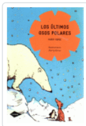
ULTIMOS OSOS POLARES, LOS (COMETA) HORSE, HARRY