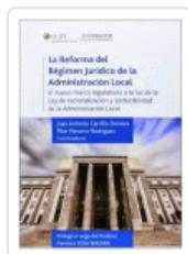
REFORMA DEL REGIMEN JURIDICO DE LA ADMINISTRACION LOCAL VARIOS AUTORES