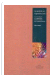
APUESTA POR LA GLOBALIZACION GOWAN