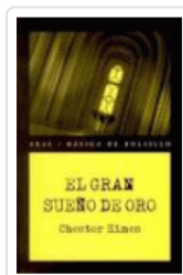
GRAN SUEÑO DE ORO