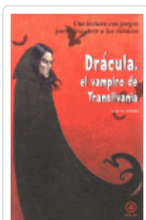
DRACULA, EL VAMPIRO DE TRANSILVANIA JUAREZ, JORGE M.