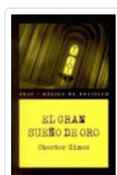
GRAN SUEÑO DE ORO