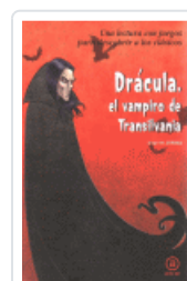
DRACULA, EL VAMPIRO DE TRANSILVANIA JUAREZ, JORGE M.