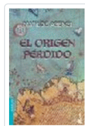
ORIGEN PERDIDO (NF) MATILDE ASENSI