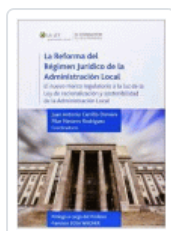
REFORMA DEL REGIMEN JURIDICO DE LA ADMINISTRACION VARIOS AUTORES