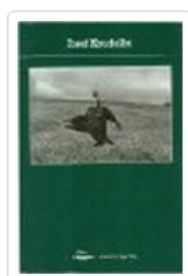
JOSEF KOUDELKA POTOPOCHE PHOTOPOCHE