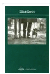
ELLIOT ERWITT POTOPOCHE PHOTOPOCHE