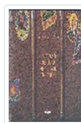
EDAD DE ORO DEL VIAJE EN TREN, LA AA.VV.