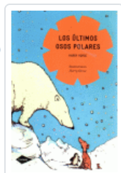
ULTIMOS OSOS POLARES, LOS (COMETA) HORSE, HARRY