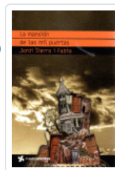
MANSION DE LAS MIL PUERTAS, LA (CUATROVIENTOS) SIERRA I FABRA, JORDI