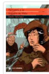
MARCABRU Y LA HOGUERA DE HIELO (CUATRO VIENTOS) TEIXIDOR, EMILI