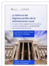
REFORMA DEL REGIMEN JURIDICO DE LA ADMINISTRACION LOCAL VARIOS AUTORES