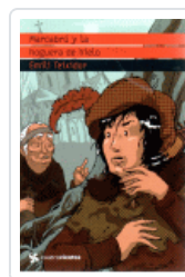
MARCABRU Y LA HOGUERA DE HIELO (CUATROVIENTOS) TEIXIDOR, EMILI