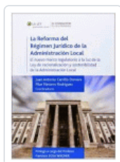
REFORMA DEL REGIMEN JURIDICO DE LA ADMINISTRACION LOCAL VARIOS AUTORES