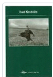
JOSEF KOUDELKA PHOTOPOCHE