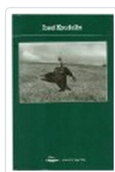
JOSEF KOUDELKA POTOPOCHE POTOPOCHE