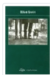
ELLIOT ERWITT POTOPOCHE POTOPOCHE