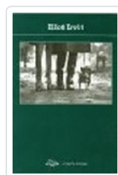
ELLIOT ERWITT PHOTOPOCHE