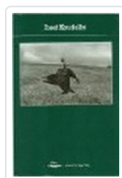
JOSEF KOUDELKA PHOTOPOCHE