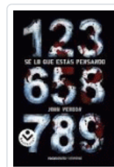
SE LO QUE ESTAS PENSANDO (LIMITED) VERDON, JOHN