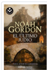
ULTIMO JUDIO, EL GORDON, NOAH