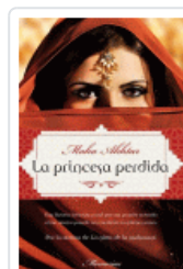
PRINCESA PERDIDA, LA AKHTAR, MAHA