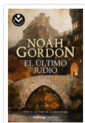
ULTIMO JUDIO, EL GORDON, NOAH