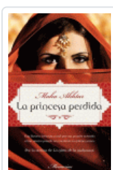
PRINCESA PERDIDA, LA AKHTAR, MAHA