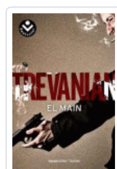
MAIN, EL TREVANIAN