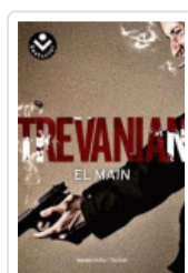
MAIN, EL TREVANIAN