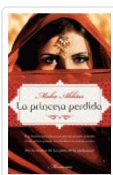
PRINCESA PERDIDA, LA AKHTAR, MAHA