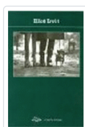
ELLIOT ERWITT POTOPOCHE POTOPOCHE