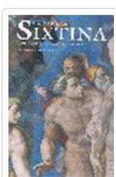
CAPILLA SIXTINA PFEIFFER,H.X