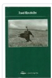
JOSEF KOUDELKA POTOPOCHE POTOPOCHE