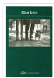
ELLIOT ERWITT POTOPOCHE POTOPOCHE