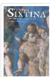
CAPILLA SIXTINA PFEIFFER, H.X.