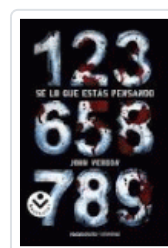
SE LO QUE ESTAS PENSANDO (LIMITED) VERDON, JOHN