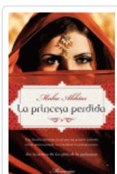
PRINCESA PERDIDA, LA AKHTAR, MAHA