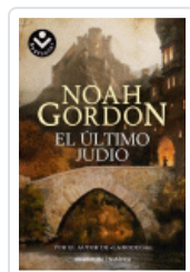
ULTIMO JUDIO, EL GORDON, NOAH