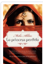
PRINCESA PERDIDA, LA AKHTAR, MAHA