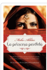
PRINCESA PERDIDA, LA AKHTAR, MAHA