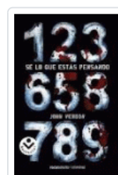
SE LO QUE ESTAS PENSANDO (LIMITED) VERDON, JOHN