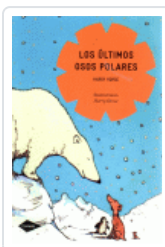
ULTIMOS OSOS POLARES, LOS (COMETA)