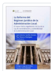
REFORMA DEL REGIMEN JURIDICO DE LA ADMINISTRACION VARIOS AUTORES