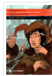
MARCABRU Y LA HOGUERA DE HIELO (CUATROVIENTOS)