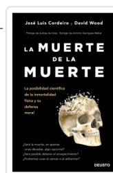
MUERTE DE LA MUERTE, LA CORDEIRO MATEO, JOSE LUIS / WOOD, DAVID