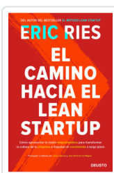
CAMINO HACIA EL LEAN STARTUP, EL RIES, ERIC