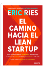
CAMINO HACIA EL LEAN STARTUP, EL RIES, ERIC