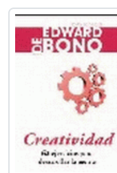
CREATIVIDAD DE BONO, E.