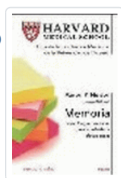
MEMORIA (HARVARD MEDICAL SCHOOL) NELSON, A