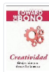
CREATIVIDAD DE BONO, E.