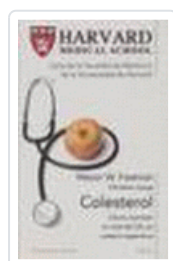
COLESTEROL (HARVARD MEDICAL SCHOOL) FREEMAN, M