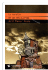
MANSION DE LAS MIL PUERTAS, LA (CUATROVIENTOS) SIERRA I FABRA, JORDI