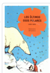
ULTIMOS OSOS POLARES, LOS (COMETA) HORSE, HARRY