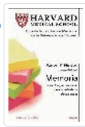
MEMORIA (HARVARD MEDICAL SCHOOL) NELSON, A