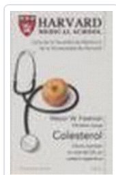
COLESTEROL (HARVARD MEDICAL SCHOOL) FREEMAN, M