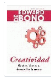
CREATIVIDAD DE BONO, E.