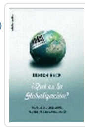
QUE ES LA GLOBALIZACION?