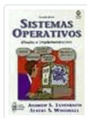
SISTEMAS OPERATIVOS DISEÑO IMPLEMENT 2 E