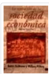
EVOLUCION DE LA SOCIEDAD ECONOMICA