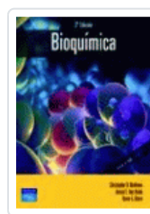
BIOQUIMICA 3 ED