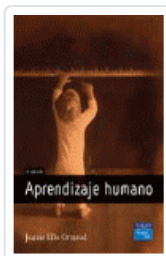
APRENDIZAJE HUMANO 4ªED Ormrod, Jeanne Ellis