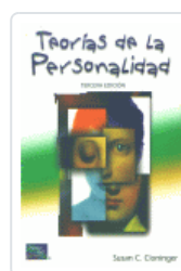
TEORIAS DE LA PERSONALIDAD 3ªED CLONINGER, SUSAN C.