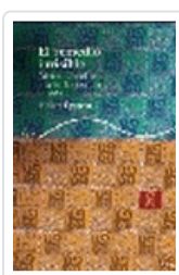
REMEDIO INVISIBLE, EL EPSTEIN, H