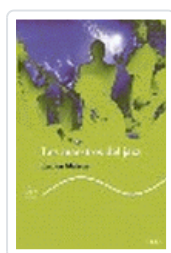
MAESTROS DEL JAZZ, LOS MALSON, L