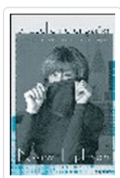
CUELLO NO ENGAÑA, EL EPHRON, N