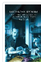
CONAN DOYLE, DETECTIVE COSTELLO, P