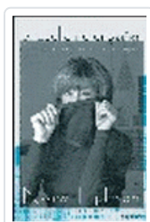
CUELLO NO ENGAÑA, EL EPHRON, N