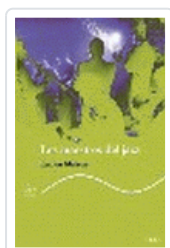
MAESTROS DEL JAZZ, LOS MALSON, L