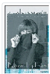
CUELLO NO ENGAÑA, EL EPHRON, N