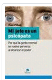
MI JEFE ES UN PSICOPATA PIÑUEL, I