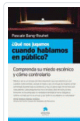
QUE NOS JUGAMOS CUANDO HABLAMOS EN PÚBLICO PASCALE BANGROUHET