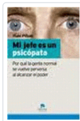
MI JEFE ES UN PSICOPATA PIÑUEL, I