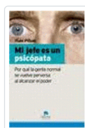
MI JEFE ES UN PSICOPATA PINUEL, I