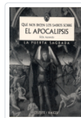
QUE NOS DICEN LOS SABIOS SOBRE EL APOCALIPSIS Acevedo Pérez, Félix