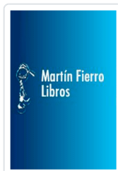
GUÍA COMPLETA DE HOMEOPATÍA Lockie, Andrew