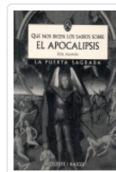
QUE NOS DICEN LOS SABIOS SOBRE EL APOCALIPSIS Acevedo Pérez, Félix