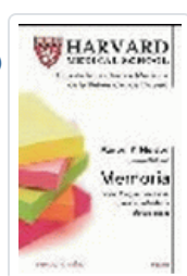
MEMORIA (HARVARD MEDICAL SCHOOL) NELSON, A