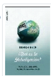
QUE ES LA GLOBALIZACION?