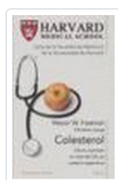
COLESTEROL (HARVARD MEDICAL SCHOOL) FREEMAN, M