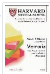
MEMORIA (HARVARD MEDICAL SCHOOL) NELSON, A