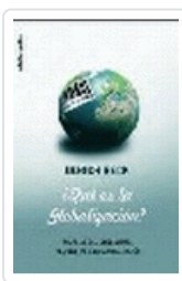
QUE ES LA GLOBALIZACION?