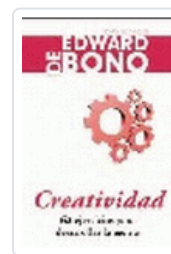
CREATIVIDAD DE BONO, E.