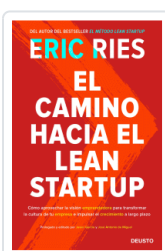
CAMINO HACIA EL LEAN STARTUP, EL RIES, ERIC