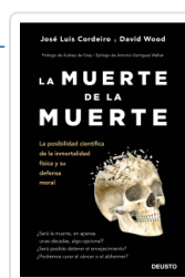
MUERTE DE LA MUERTE, LA CORDEIRO MATEO, JOSE LUIS / WOOD, DAVID